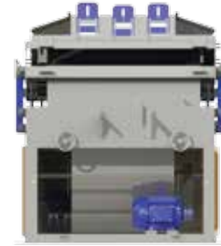
Dois motores de acionamento Weg Plus Two Weg Plus drive motors