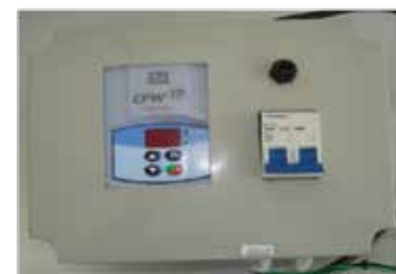
Controle de Vibração Eletrônico Electronic Vibration Control